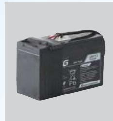
バッテリー (12V 8Ah)