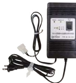
充電器 適合容量 5Ah～12Ah