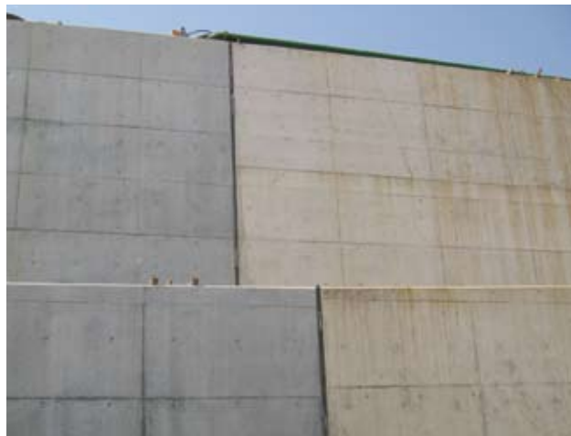
▲地下構造物の目地に使用