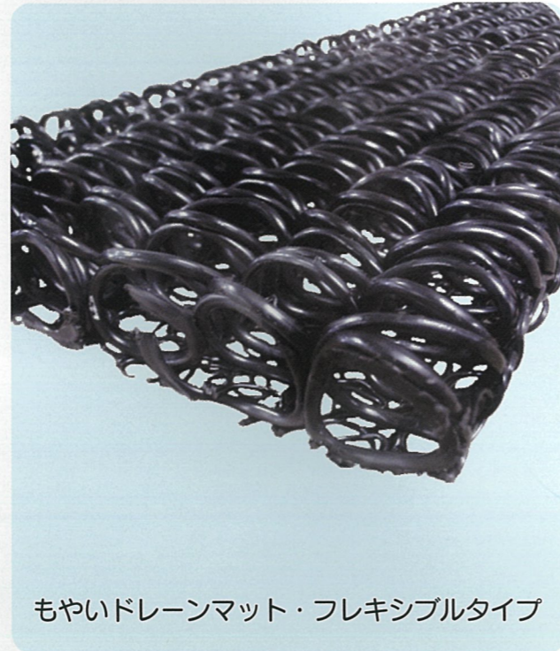
もやいドレーンマット・フレキシブルタイプ