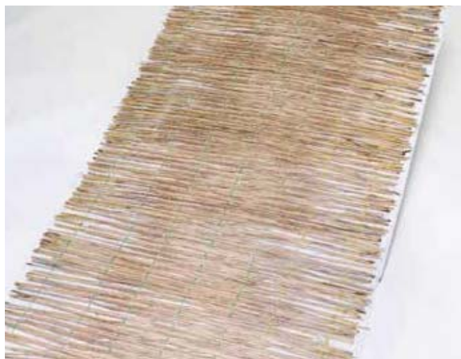
※写真はロンケット ワラです。